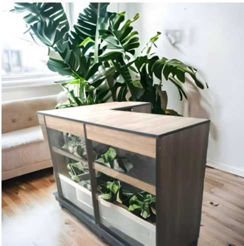
CHECKOUT FRENTE VIDRO Medidas: 140 x 100cm